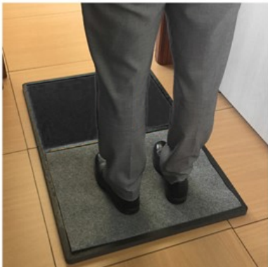
PASO 1 - Use la esterilla impregnada con desinfectante para limpiar el calzado.