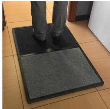
PASO 2 - Use la esterilla superior para secar. Acceda al recinto con garantía de higiene.